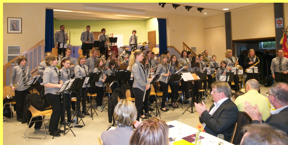
Kiermesconcert Groussbus 2013