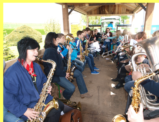
Hämmlsmarsch Groussbus 2013